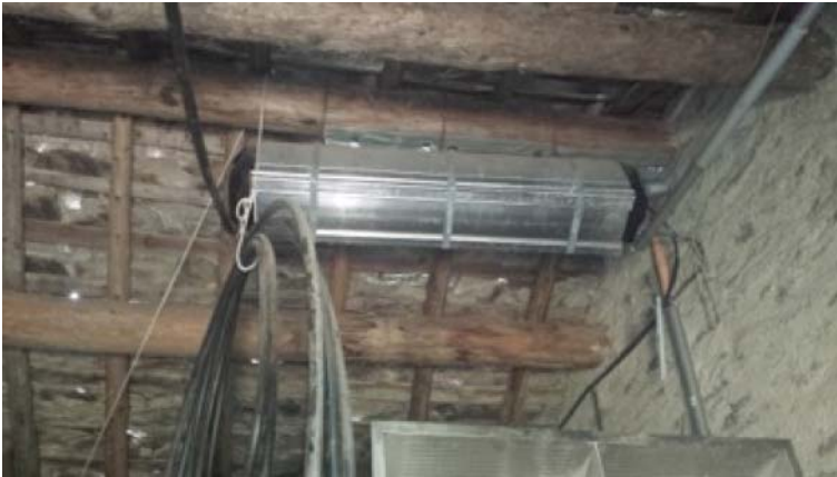
Supporti da sostituire