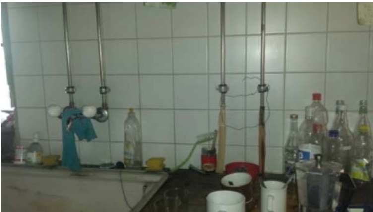
Sistemazione impianto e rubinetteria