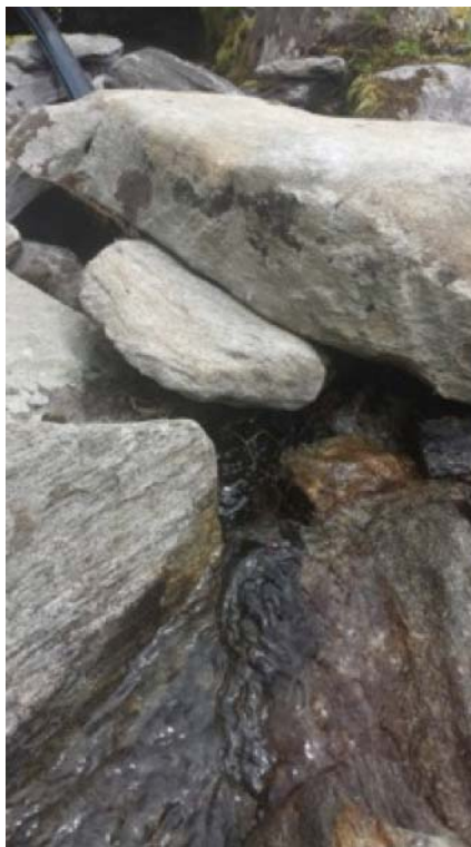
Captazione esistente non a norma